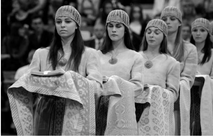
Iki mokyklų tinklo reorganizacijos abiturientų brandos atestatus įnešdavo pirmokėliai. Šie metai - pirmieji, kai Anykščių J. Biliūno gimnazijoje yra tik 9 - 12 klasės.