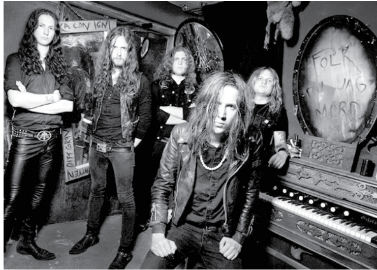
Grupė „In Solitude“ - svečiai iš Švedijos

Jau ši savaitgalį muzikos fanai pasiners į roko ir ekstremalios muzikos festivalio „Velnio Akmuo“ atmosferą. Šis per keletą metų išaugęs, profesionaliais pasirodymais pasižymintis Anykščių vasaros festivalis šiemet vilioja rekordiniu grupių skaičiumi – 35. Pasak organizatorių, išklaudyti visas nuo pradžios iki galo bus neįmanoma, tad publikai teks planuoti ir rinktis savo favoritus. Festivalio organizatoriai rekomenduoja atlikėjų sąrašą, kuriame yra trečdalis išskirtiniausių festivalio grupių.