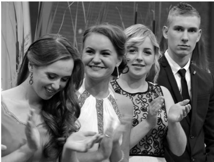
Brandos atestatų įteikimas buvo „garsus“ - abiturientai vieni kitus sveikino plojimais ir šūksniais.