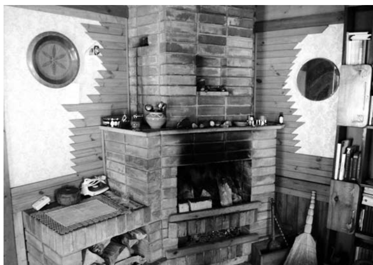
Krosnis senojoje Antano Drilingos sodyboje. Ant jos viršaus vaikystėje šildydavosi Antanas su broliu ir seserimi.

susipažino dar ankstyvoje jaunystėje. O sulaukęs trisdešimties kūrėjas gavo pasiūlymą vadovauti atgimusiui leidiniui „Moksleivis”. Tai, pasak rašytojo, buvo tikrai mokyklinis žurnalas – jame buvo publikuojama mokinių kūryba, rašoma apie mokinių gyvenimą.